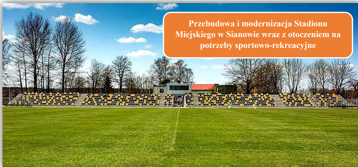
Przebudowa i modernizacja Stadionu Miejskiego w Sianowie wraz z otoczeniem na potrzeby sportowo-rekreacyjne