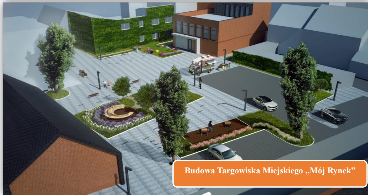
Budowa Targowiska Miejskiego „Mój Rynek”